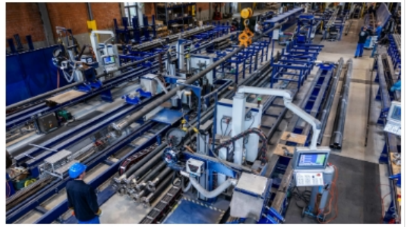
Die Abreißanlage in einer Produktionshalle der Firma Schmidt + Clemens in Kaiserau.