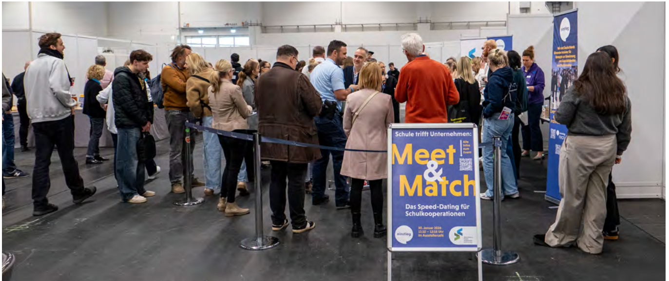
VERTRETER:INNEN DER SCHULEN & UNTERNEHMEN BEIM „MEET & MATCH“ AUF DER EINSTIEG KÖLN 2026