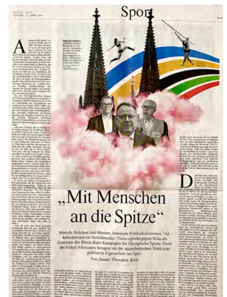
UNSER ENGAGEMENT FÜR OLYMPIA KÖLN RHEINRUHR | ARTIKEL FAZ VOM 18.04.26